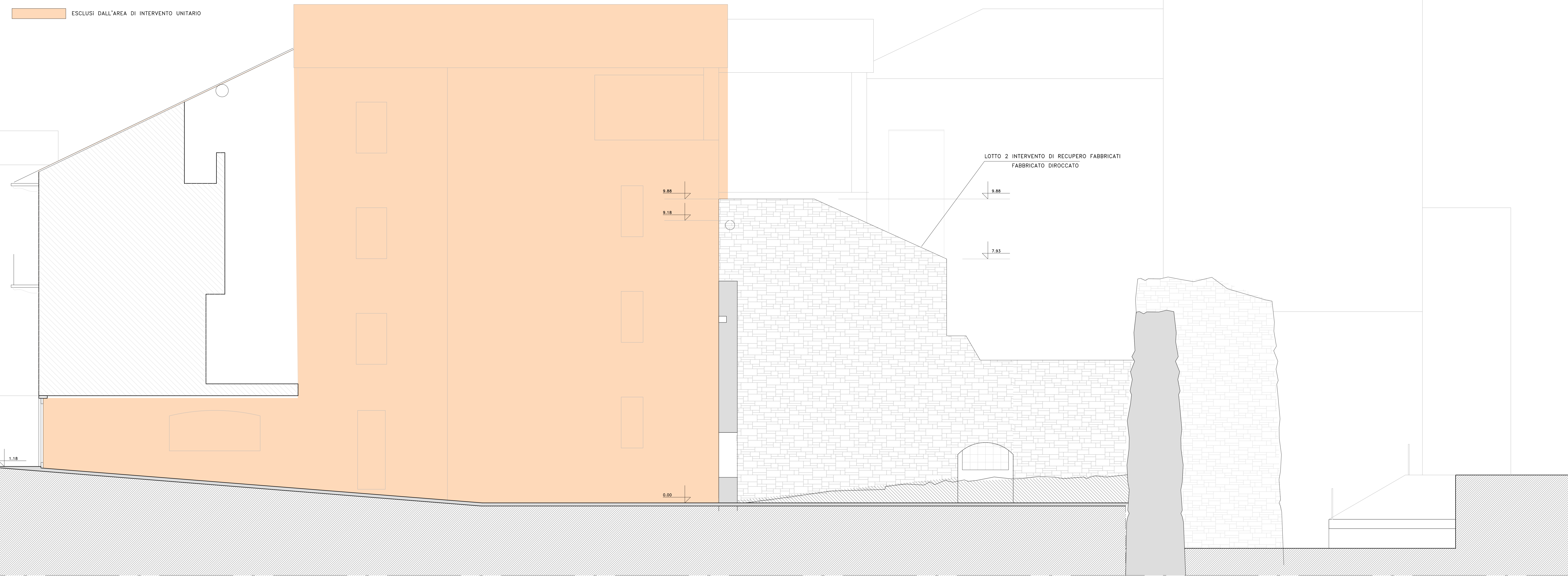
SEZIONE A - A LOTTO 1 - RIQUALIFICAZIONE SPAZI ESTERNI

ESCLUSI DALL'AREA DI INTERVENTO UNITARIO